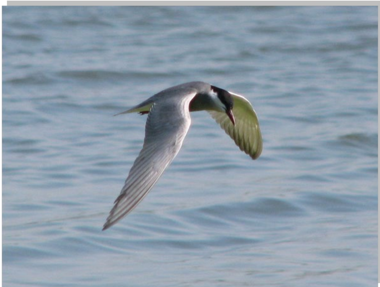
Chlidonias hybridus Белобрка чигра , врло ретка пролазница СРП „Увац“

Chlidonias hybridus Белобрка чигра , две птице, 30. април, Златарско језеро.