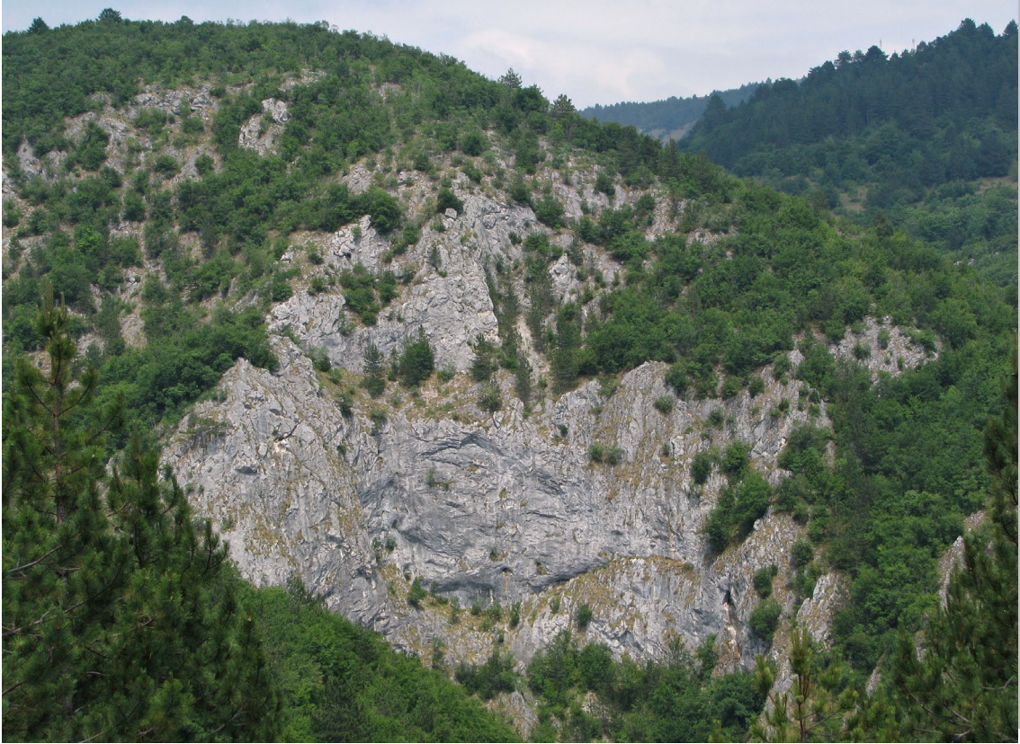
Клисура Доброселичке реке

Захваљујући великом повећању броја парова белоглавих супова у СРП „Увац“ у последњих неколико година дошло је до проширења колоније и насељавања следећих локалитета: Мучањ, Нинаја, Оштрик, Доброселичка река, Муртеница и кањон Лима.