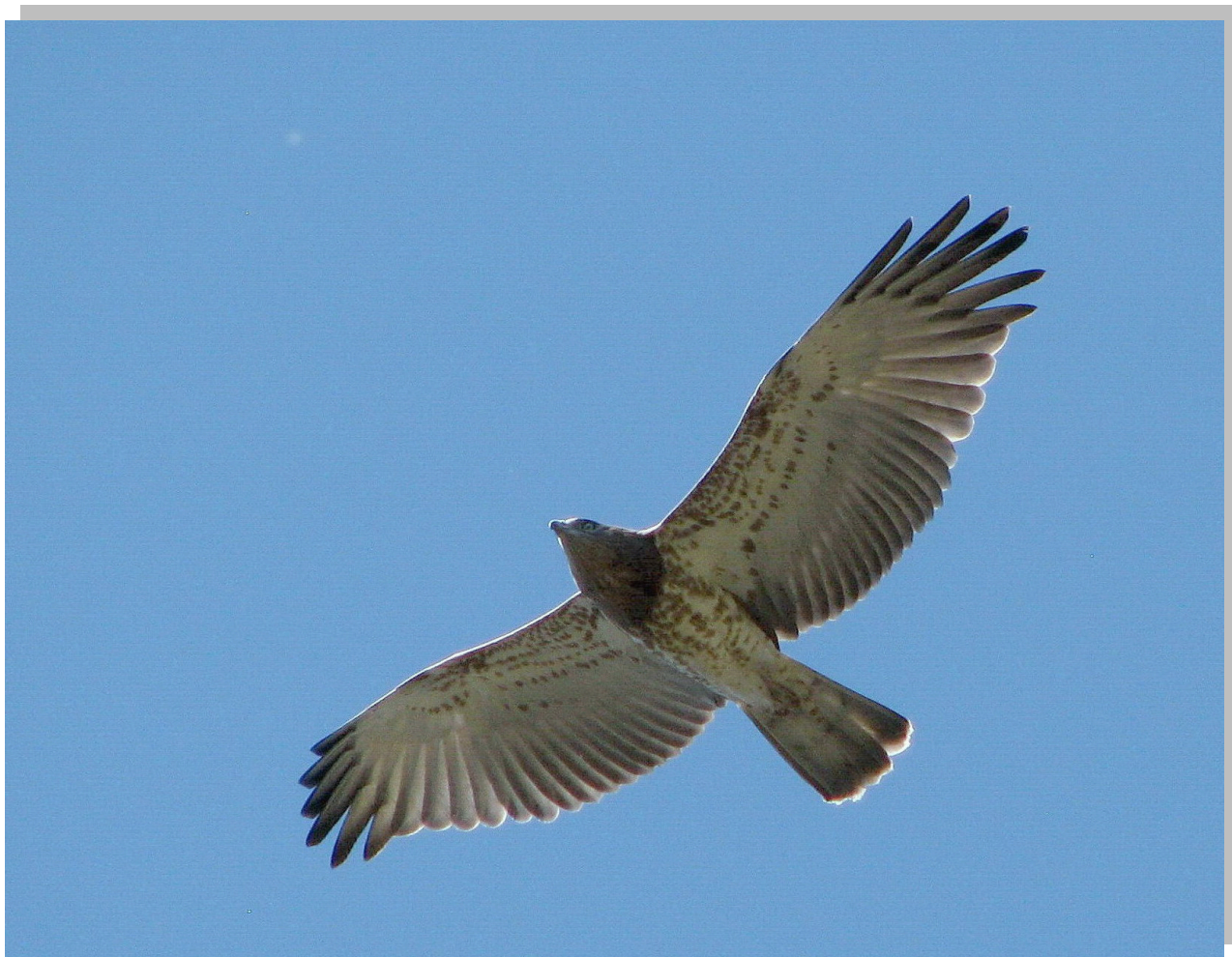
Circaetus gallicus Змијар , ретка гнездарица селица СРП „Увац“

Circaetus gallicus Змијар две птице, 10. април, Радоиња; 1. мај, Кладница; територијално понашање два мужјака, 16. мај, Радоиња; адултни мужјак, 20. јун, Вељушница; змијар носи змију у кљуну, 1. јул, Радоиња; пар адулта, 7. јул, Увачко језеро, брана; пар адулта, 13. јул, Радоиња; територијално понашање два мужјака, 4. август, Увачко језеро, брана; 12. август, Вељушница; пар адулта, 24. август, Увачко језеро, брана; 28. август, Увачко језеро, брана. Гнездарица селица резервата Увац на чијем подручју се гнезде 3-4 пара.