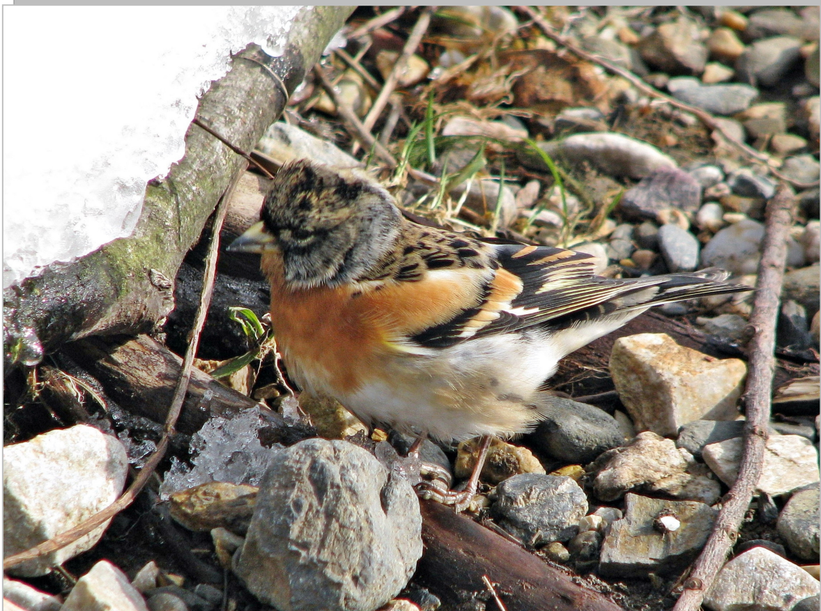
Fringilla montifringilla Северна зеба , ретка зимовалица СРП „Увац“

Fringilla montifringilla Северна зеба , 20 птица, 20. фебруар, Златарско језеро.