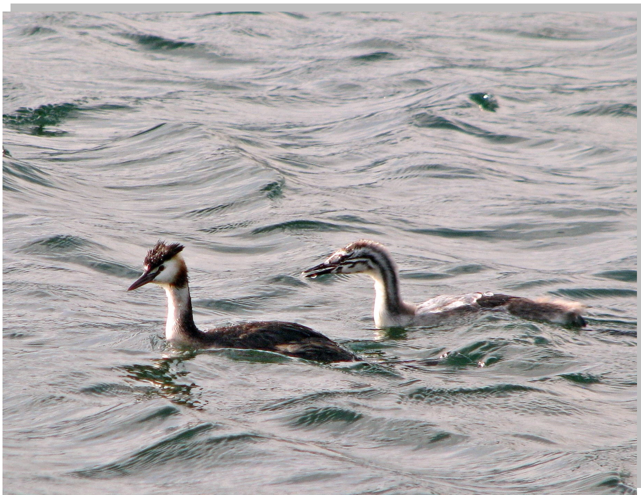
Podiceps cristatus Ћубасти гњурац , ретка пролазница СРП „Увац“

Podiceps cristatus Ћубасти гњурац , 17. октобар, Златарско језеро; две птице, 24. октобар, Златарско језеро.