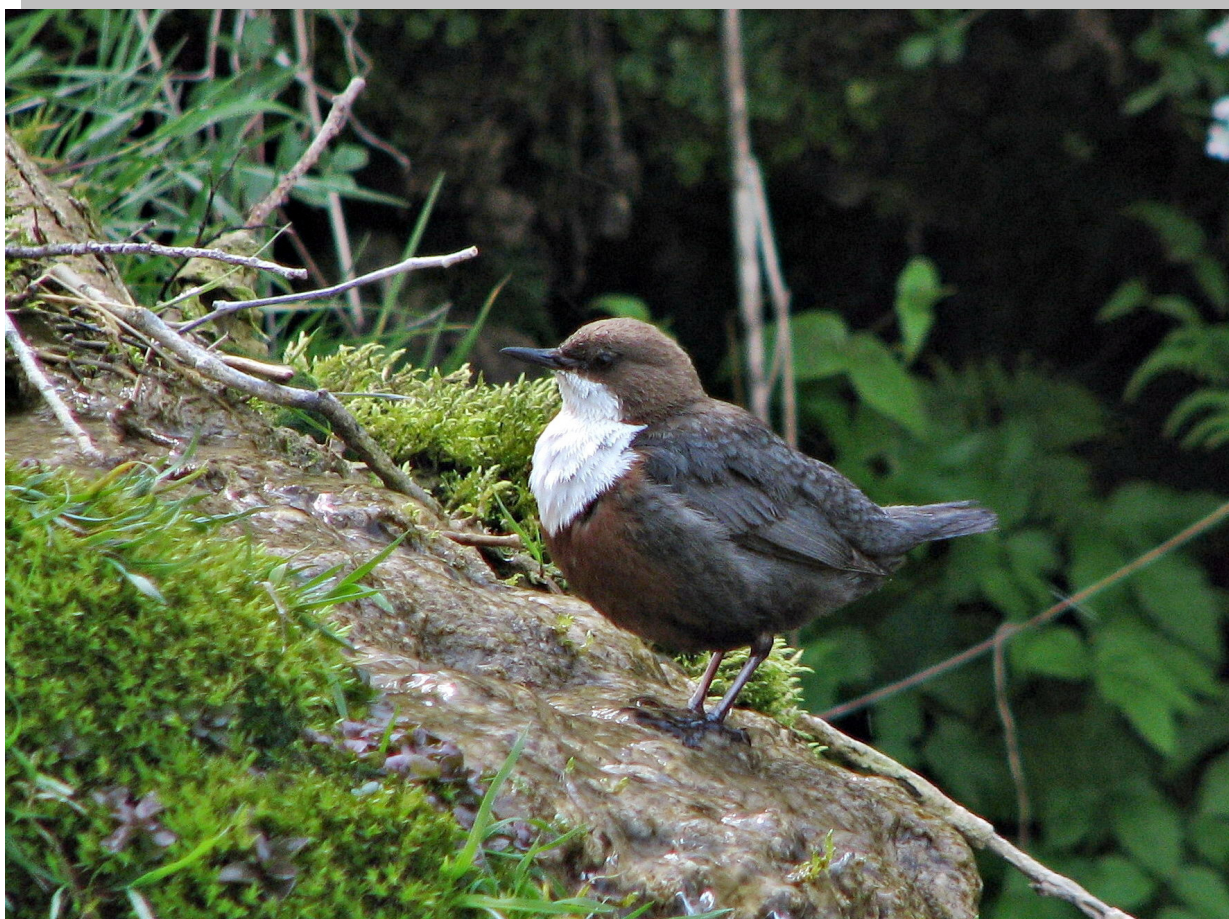
Cinclus cinclus Воденкос , гнездарница станарица СРП „Увац“

погрешно идентификоване. Сумирањем свих ових података дошло се до укупног броја од 210 забележених врста птица у претходном периоду, од тога су 121 гнездарнице. Због тога је подручје резервата Увац идентификовано као подручје значајно за птице ( Important Bird Areas – IBA ). По птицама грабљивицама ово је један од највреднијих делова Србије (10 гнездарница), а посебно је значајно присуство белоглавог супа, сурог орла, змијара, сивога сокола и осичара. Најзначајнији представници сова су: буљина, дугорепа сова, гађаста кукумавка, ћук и шумска сова. Значајне гнездарнице су и лештарка, камењарка, шумска шљука, лешникара, полојка, прдавац, легањ, воденкос, кос камењар, горска ластва и пузгавац. Увачка језера су значајно одмориште за птице за време сеобе, а то се нарочито односи на птице водених станишта од којих неке и зимују у резервату. На њима се гнезди највреднија и најстарија национална популација великог ронца.