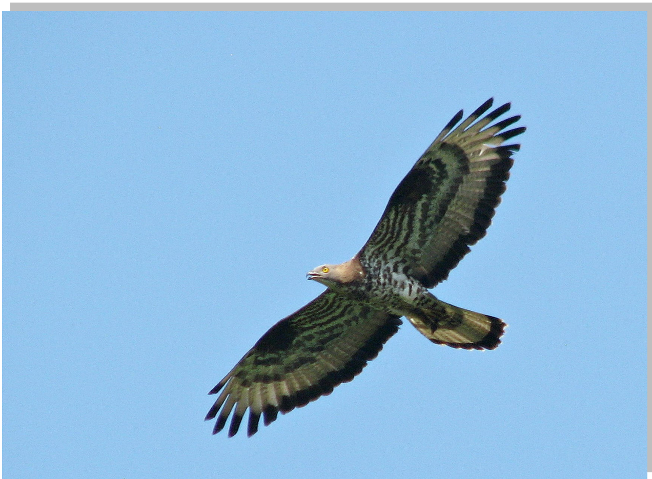
Pernis apivorus Осичар , ретка гнездарица селица СРП „Увац“

Pernis apivorus Осичар , 29. мај, Радоиња; женка, 1. јул, Радоиња; 7. јул, Увачко језеро, брана; 21. јул, Златарско језеро; 8. август, Радоиња. Гнездарица селица резервата Увац на чијем подручју се гнезди 4-5 парова.