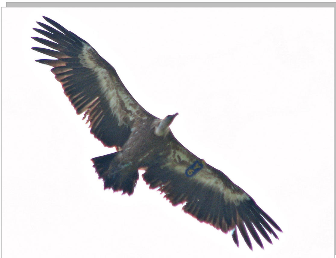
Белоглави суп Јуањо Y6 обележен у Кресној Гори у Бугарској

У резервату Увац налази се и 7 белоглавих супова са сателитским праћењем, који су обележени бугарским одашиљачима на пројекту који води Vulture Conservation Foundation: Горлич Y1 , Витлеи Y2 , Јуањо Y6 , Синанитс Y9 , Сунчица C5 , Врачан A4 и суп YE . Птице су завичајне из колоније Увац, ухваћене су у клопку на миграцији кроз Бугарску у Кресној Гори и једна у Северној Македонији, када су им постављене сателитске платформе. Птице су се вратиле у завичајне колоније на Увцу и Радоињи.