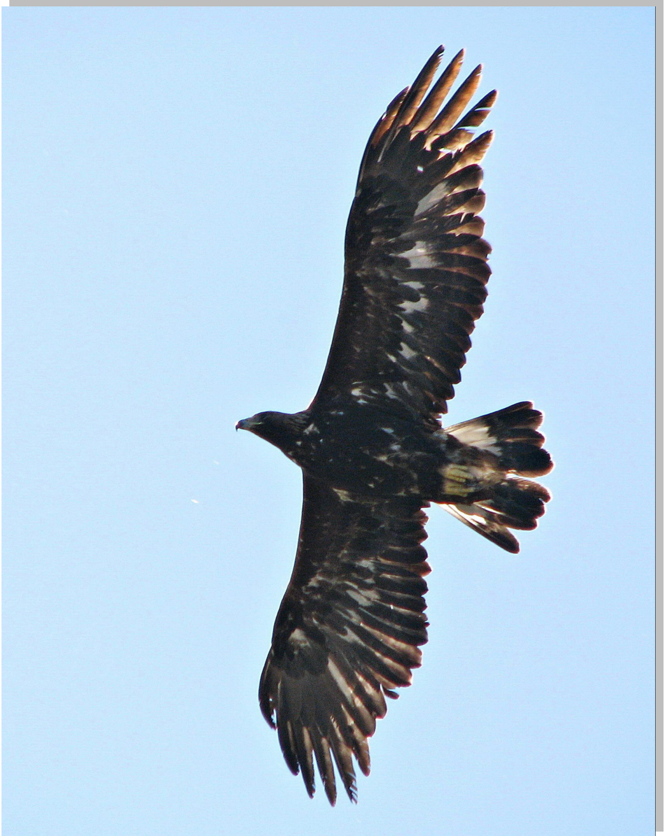
Aquila chrysaetos Сури орао , ретка гнездарица станарица СРП „Увац“

Током истраживања забележено је 16 врста птица грабљивица од којих су 10 гнездарице а остале су пролазнице и луталице.