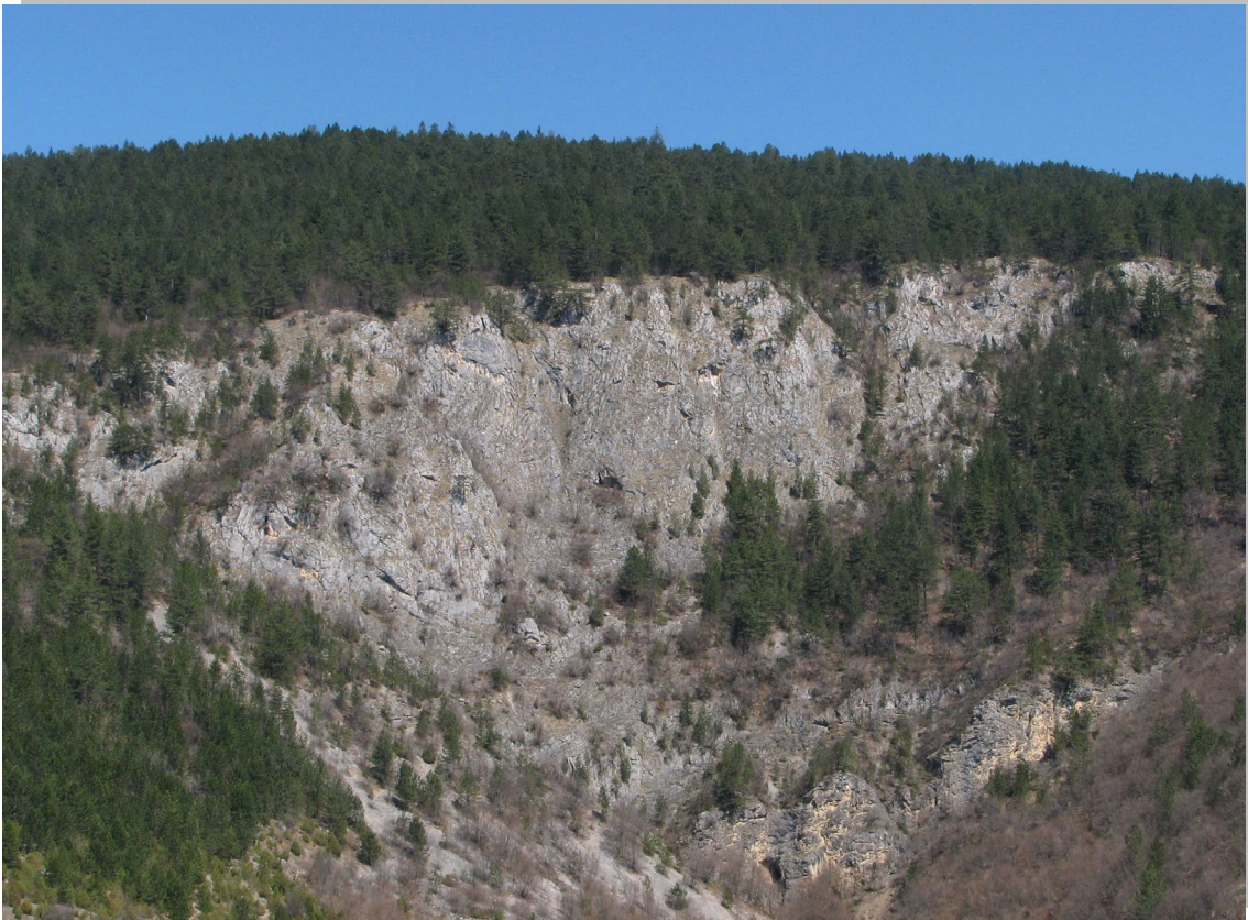
Кречњачка стена на Муртеници