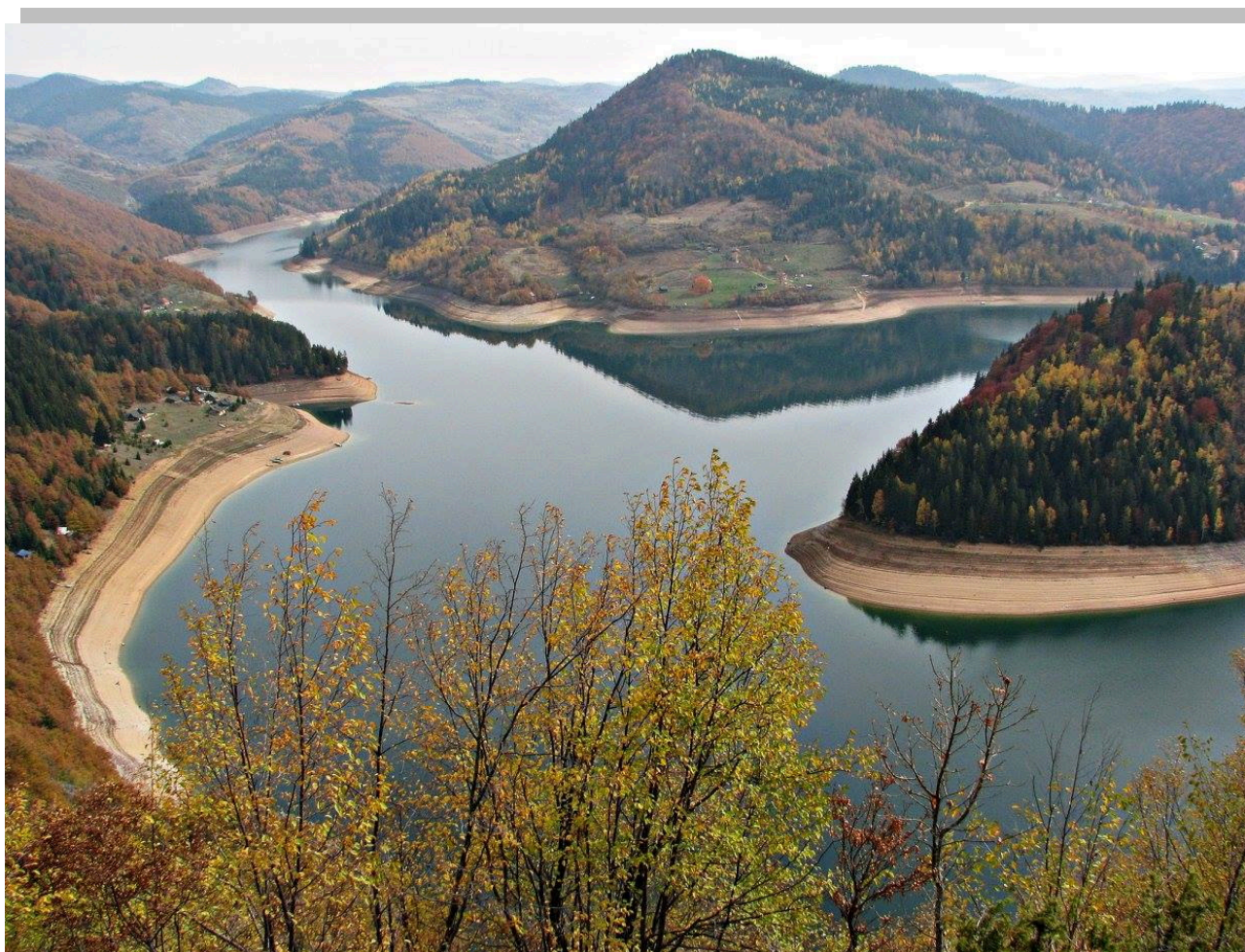
Златарско језеро, проблем изградње нелегалних објеката и даље је присутан