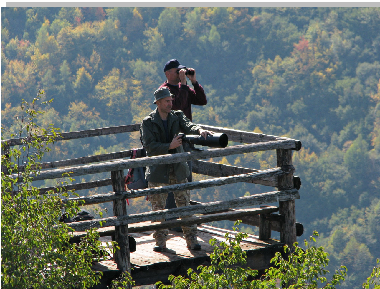
Видиковац Молитва, истраживање диверзитета птица СРП „Увац“

У истраживању диверзитета птица СРП „Увац“ у 2021. години учествовали су орнитолози, чланови и пријатељи Еколошког удружења „Чувари природе“ из Пожеге уз логистичку подршку чуварске службе резервата.