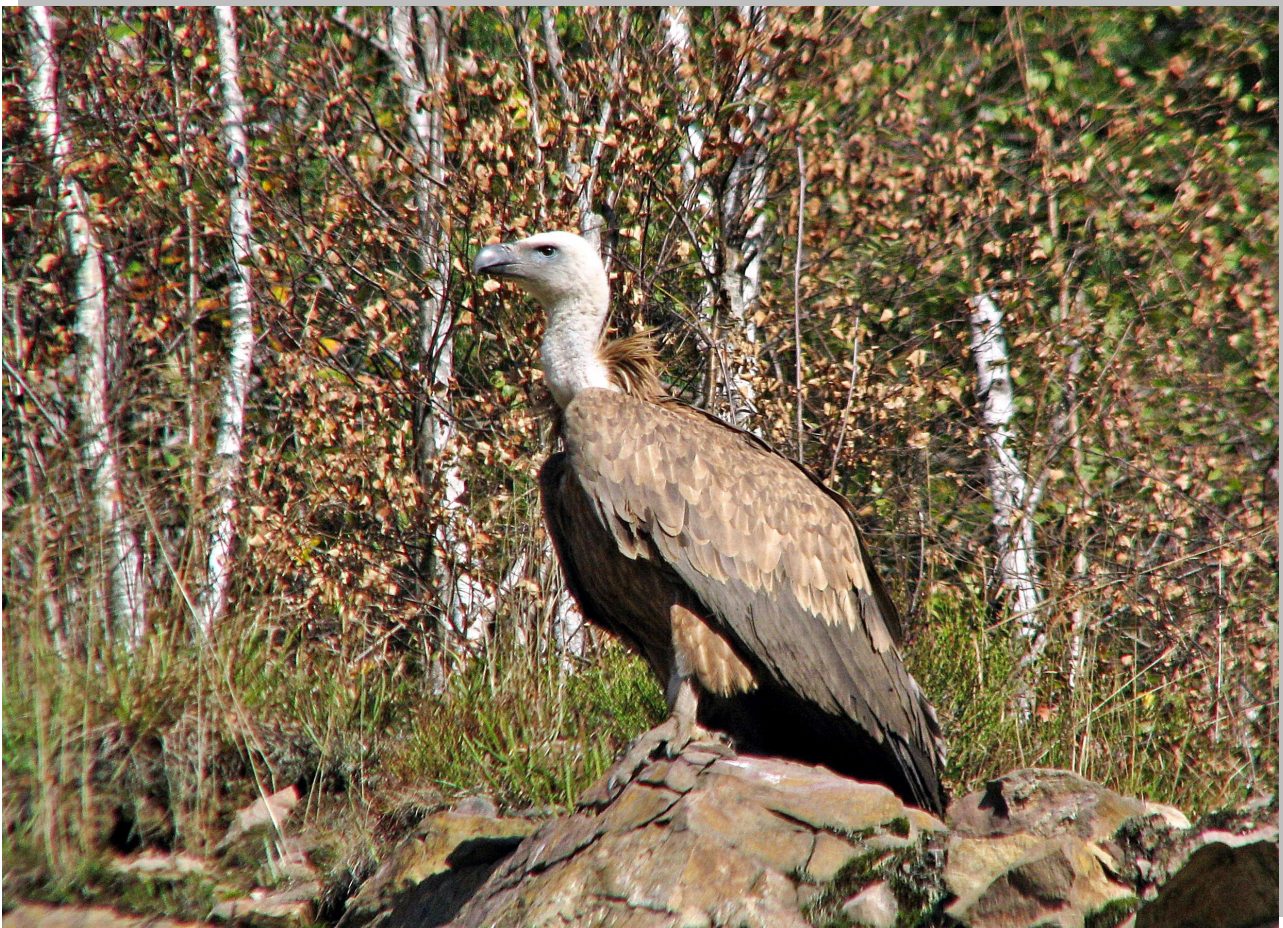
Gyps fulvus Белоглави суп