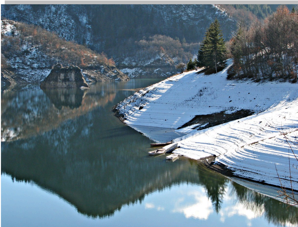
Златарско језеро, Пуљци

Специјални резерват природе "Увац" је природно добро од изузетног значаја за Републику Србију, природно добро I категорије. Налази се у југозападној Србији у оквиру Старовлашко–рашке висије. Окружен је планинама Златар, Муртеница, Чемерница, Јавор и Јадовник и захвата површину од 7543 ha. Новом Уредбом о заштити специјалног резервата природе Увац границе резервата биће проширене на 11.746,19 ha. Минимална надморска висина резервата је 760 м, а максимална 1322 м. Заштићено подручје обухвата долине реке Увац између брда Лупоглав у међуречју Увца и Вапе и бране на Радоињском језеру и делове долина притока Увца–потока Чајак, Ракоњског, Пурића, Рабреног, Секулића и Дубоког потока, Вељушнице, Злошнице, Волујачког потока, Марића реке, Тисовице, Суводола, Вршевине и Кладнице. У склопу резервата налазе се и три језера настала изградњом брана на реци Увац: Увачко (Сјеничко)–25 км, Златарско–27 км и Радоињско–11 км. Она утичу на микроклиму подручја и састав фауне птица.